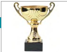
Ceremonia de premios de la 3era. Edición del Premio Instituto de ICC