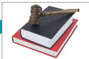
Se lanzaron las nuevas y revisadas reglas de ICC sobre arbitraje

> París 09.2011 > > > > > > Nairobi 27-30.09.2011 > > > > > Oslo 17.10.2011 > > >