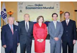
Se reúne el Grupo Consultivo Regional de ICC

> Antigua 04-05.11.2010 > > > > > > Seúl 09.11.2010 > > > > > > Seúl 10-11.11.2010 > > > >