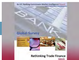
ICC publica la Encuesta sobre el Financiamiento del Comercio Mundial

> Pekín 21-23.04.2010 > > > > Toronto 25-27.06.2010 > > > > > Hong Kong 30.06.2010 > > >