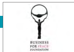
Ceremonia de Premios Empresas por la Paz