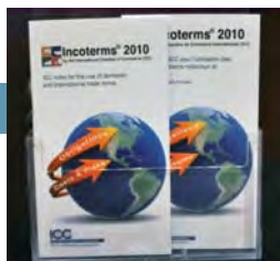
ICC lanza los Incoterms® 2010