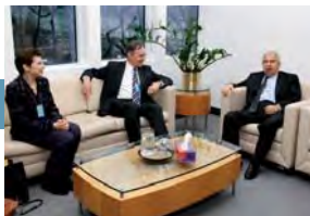
El Secretario General de ICC participa en la Cumbre de Líderes del Pacto Mundial de las Naciones Unidas