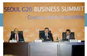
ICC estipula las perspectivas empresariales para la Cumbre del G20