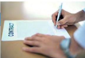
Capacitación PIDA en inglés y en español para contratos internacionales

> > > París 14-17.02.2011 > > > > > > París 16.02.2011 > > > > > > Zurich 21-23.03.2011 > >