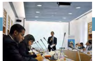
ICC realiza clases magistrales sobre las reglas Incoterms® 2010