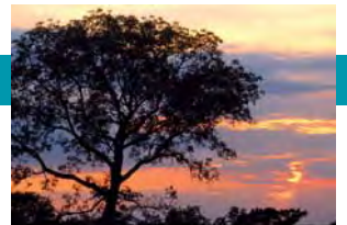
ICC contribuye con su aportación a la Conferencia sobre Cambio Climático de las Naciones Unidas (COP17)