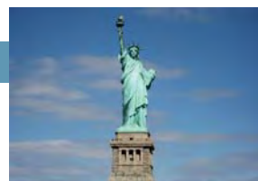
Los ganadores asistieron a la ceremonia de ICC World Business and Development awards