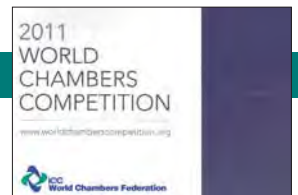
Se anuncia el ganador de la Competencia Mundial de Cámaras