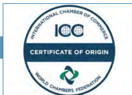
WCF lanza su cadena de certificación mundial, el Certificado de Origin