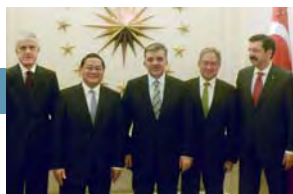
El Presidente de ICC debate sobre la recuperación económica con el Presidente de Turquía

> Ankara 13.01.2010 > > > > > Singapur 21.01.2010 > > > > Nueva York 26.01.2010 > > >