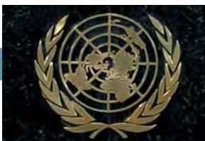
ICC pronuncia un discurso en la Cumbre de Naciones Unidas para MDGs