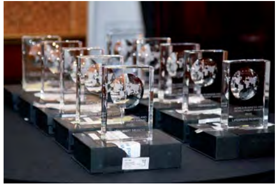
ICC organiza los Premios Mundiales de Negocios y de Desarrollo.

2011. La comisión promoverá una patente europea y un sistema de resolución de litigios en materia de patentes que sea rentable, fiable y de alta calidad, y dará a conocer las posiciones empresariales sobre los elementos del sistema propuesto. Fortalecerá su participación en la WIPO, en especial en los debates sobre patentes. Asimismo, promoverá los puntos de vista empresariales en las cuestiones de propiedad intelectual que surjan durante los debates relacionados con la extensión de los nombres de dominio genéricos de primer nivel y analizará los temas de propiedad intelectual planteadas por las redes sociales.