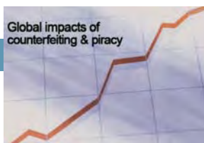
6° Congreso Global de Lucha contra la Falsificación y la Piratería