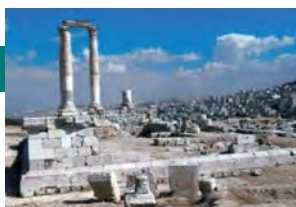
Reunión del Grupo Consultivo Regional de Medio Oriente / Norte de África