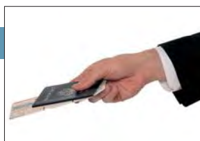
ICC participa en el Día Internacional de Aduanas