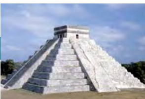
Lanzamiento del manual de PI de ICC / WIPO para cámaras de comercio

> > Ciudad de México 08-10.06.2011 > > > Ciudad de México 08-10.06.2011 > > > Ciudad de México 10.06.2011 >