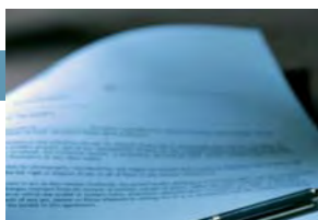
ICC define las prioridades empresariales para la Cumbre G8 / G20