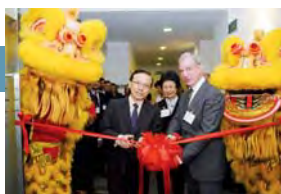
ICC inaugura la Oficina Regional en Maxwell Chambers en Singapur