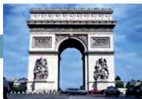
ICC organiza un seminario sobre procuración de defensa y cumplimiento con la nueva legislación de la Unión Europea

> París 01.02.2011 > > > > > > París 02-03.02.2011 > > > > > París 05-09.02.2011 > > > >