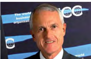
Rona Yircali, Presidente de la Federación Mundial de Cámaras (WCF) de ICC, participa en la Iniciativa R20 de Arnold Schwarzenegger, Gobernador de California

> > Sacramento 18-19.11.2010 > > > > Cancún 29.11-10.12.2010 > > > > París 30.11.2010 > >