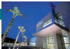
7º Congreso Mundial de Cámaras