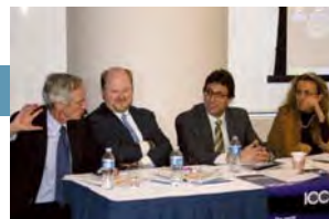
ICC lanza el Marco de Referencia sobre las Comunicaciones y la Publicidad Ambiental Responsables