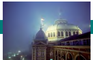
La Comisión de Competencia de ICC realiza una mesa redonda con la Red de Competencia Internacional