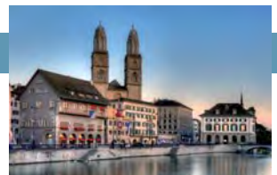
Mesa redonda sobre el debido proceso en los procedimientos de competencia