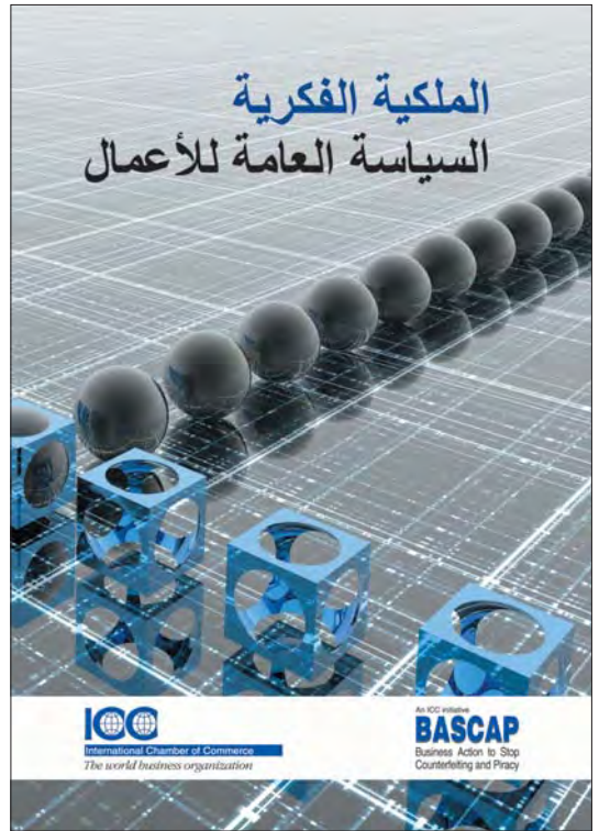
Las directrices sobre propiedad intelectual de ICC se lanzaron el 8 de junio del 2010, en El Cairo.

En el 2011, BASCAP, junto con INTERPOL, WIPO y la Organización Mundial de Aduanas (WCO), co-organizarán el Congreso Mundial de Lucha contra la Falsificación y la Piratería –la cumbre de mayor importancia, destinada a formular recomendaciones para los gobiernos nacionales. BASCAP también llevará a cabo y publicará una investigación sobre el valor que tienen las industrias basadas en la propiedad intelectual en el crecimiento económico y el empleo, y reforzará los regímenes de aplicación de la ley en lo referente a la propiedad intelectual, mediante el desarrollo de directrices