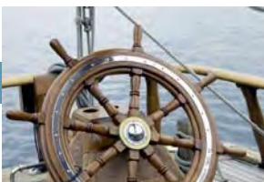
El Informe sobre Piratería de IMB para el primer trimestre del 2011

2011. ICC intensificará su campaña de promoción en apoyo de la conclusión con éxito de la Ronda de Doha en el 2011, al continuar participando con los negociadores en Ginebra, especialmente en relación con el G20. ICC también tratará de garantizar una aportación de primer nivel del mundo de los negocios en la Cumbre del G20, que se organizará en Francia en el 2011.