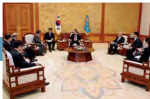
Los líderes de ICC se reúnen con el Presidente de Corea del Sur, previo a la Cumbre del G20