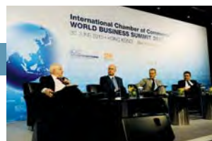
Cumbre Empresarial Mundial 2010 de ICC