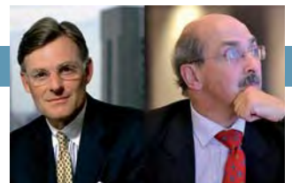
ICC elige a los nuevos Vice-Presidente y Secretario General