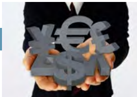
Informe del primer trimestre sobre la Encuesta Económica ICC / Ifo