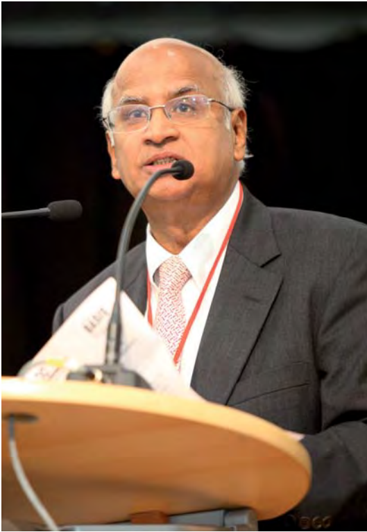
Subramanian Ramadorai, Presidente de BASIS, pronunció un discurso en la ceremonia inaugural del IGF, en la ciudad de Vilna en Lituania.

gobiernos y otras partes interesadas en transmitir las preocupaciones de la comunidad empresarial, la tarde antes de la inauguración del IGF.