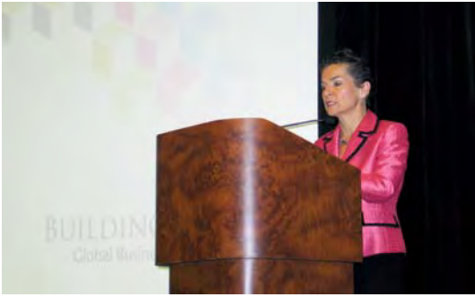
Christiana Figueres, Secretaria Ejecutiva de la Convención Marco de las Naciones Unidas sobre el Cambio Climático, participó en el Business Day organizado por ICC en la Ciudad de Cancún.