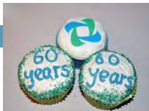
La Federación Mundial de Cámaras de ICC celebra su 60º Aniversario

> París 16.09.2010 > > > > > > París 16.09.2010 > > > > > Nueva York 21.09.2010 > >