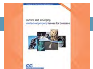
ICC publica la edición 2010 del Plan de Acción en materia de Propiedad Intelectual