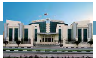
La Cámara de Comercio e Industria de Qatar es anunciada como la anfitriona del 8º Congreso Mundial de Cámaras