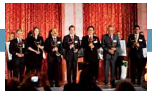
ICC co-organiza los Premios Empresas por la Paz