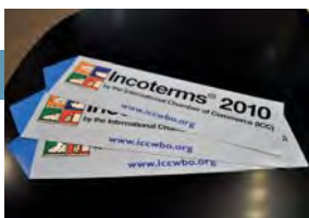
Las nuevas y actualizadas reglas Incoterms® entraron en vigor

> Mundial 01.01.2011 > > > > > París 01.01.2011 > > > > > París 24.01.2011 > > > >